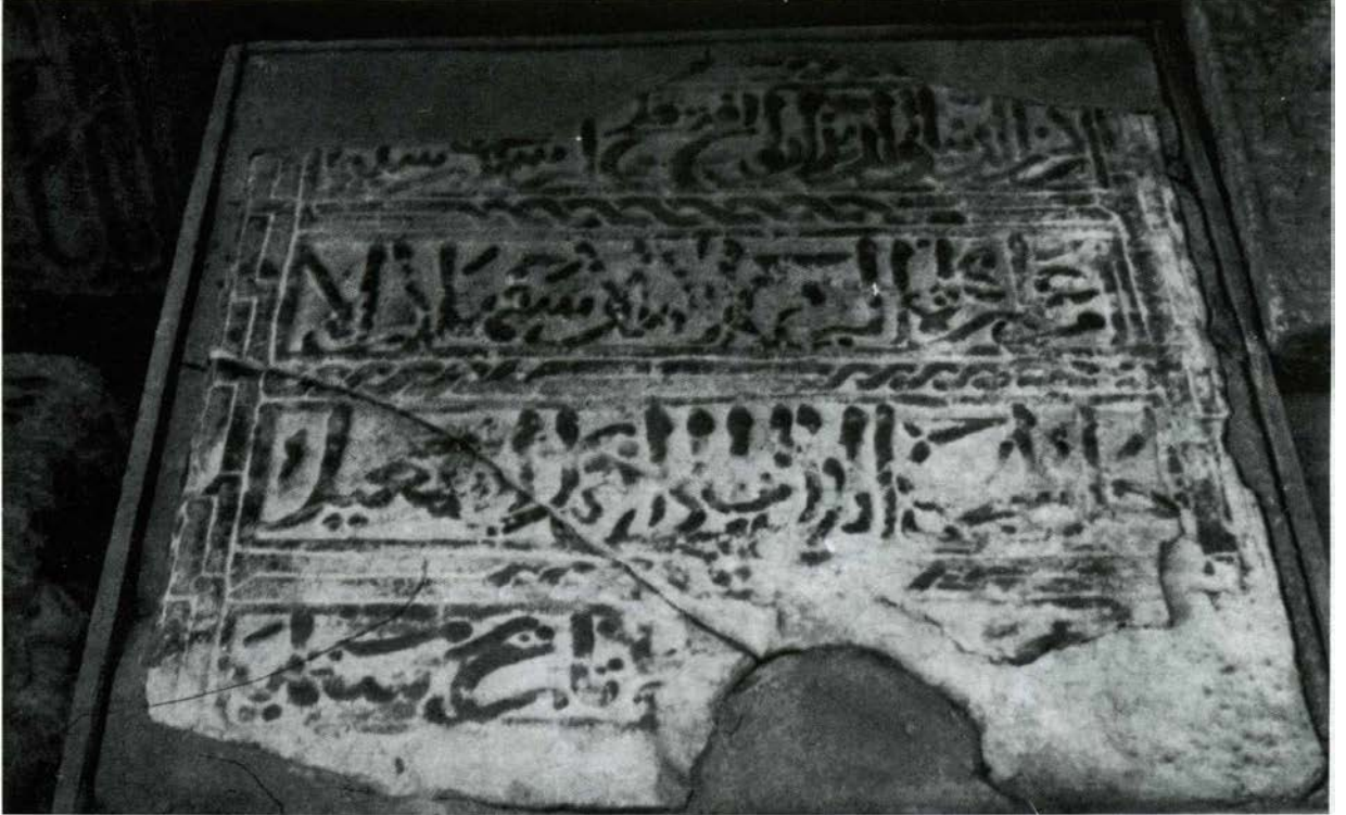
Ek-3: (R. Duran, Konya Yapı Kitabeleri ( İnşaa ve Ta'mir) Ankara 2001 ( Res. 1)