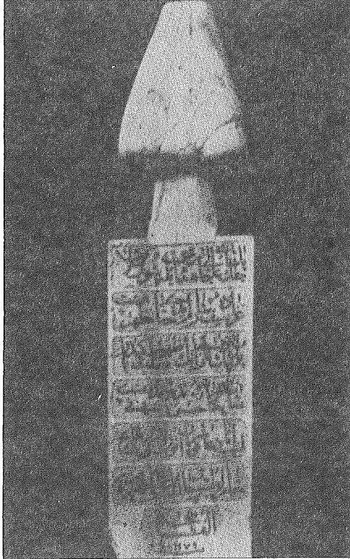
Resim 2. Çelik Mehmet Paşa'nın mezar taşı