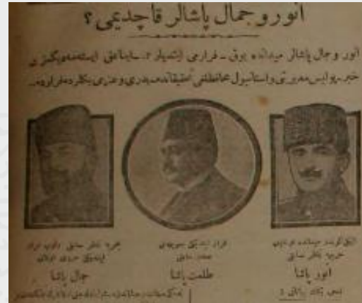
Ek 7: “Enver Cemal Paşalar Kaçtı Mı?”, 4 Teşrînievvel 1918/ 4 Ekim 1918, Yeniğün ).