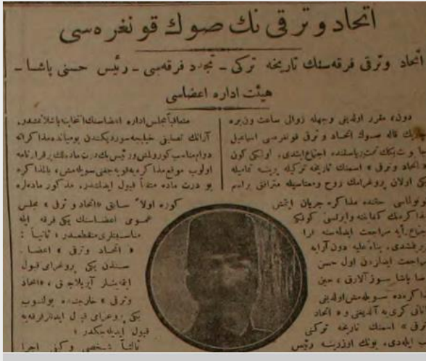
Ek 8: "İttihat ve Terakkî'nin Son Kongresi", 5 Teşrînievvel 1334/ 5 Ekim 1918, Yeniğün ).