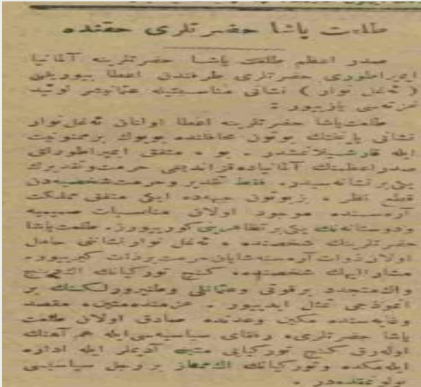
Ek 4: “Talât Paşa Hazretleri Hakkında”, 23 Mart 1333/ 23 Mart 1917, Tercümân-ı Hakikat ).