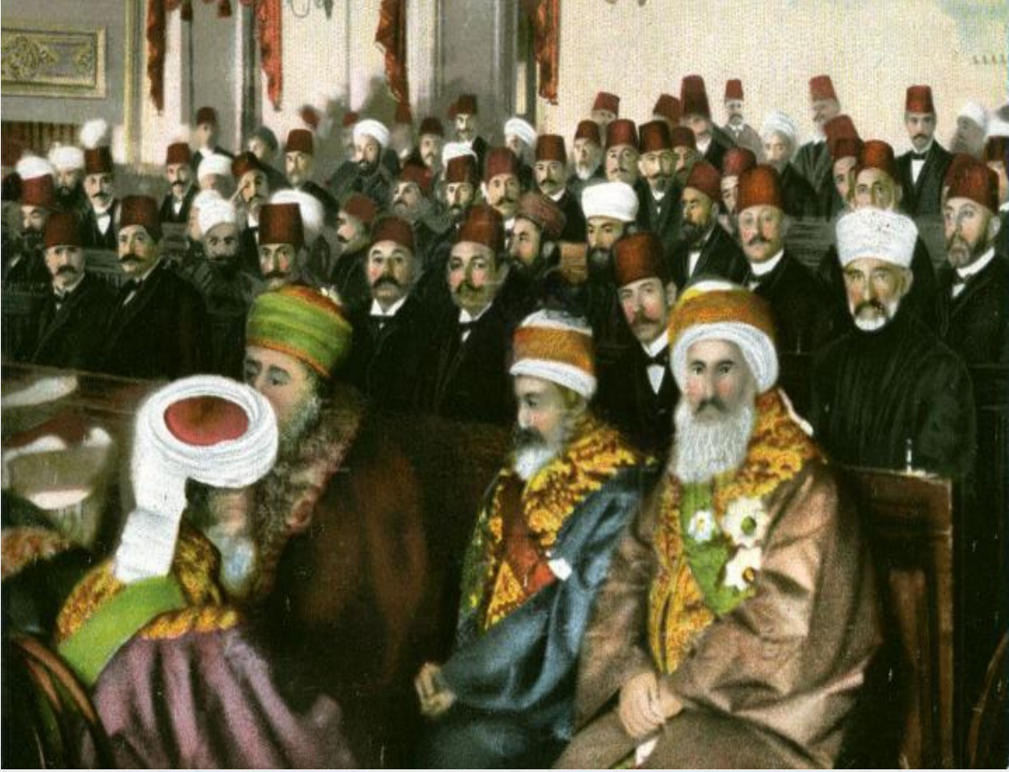
Ek 1: Mebuslardan bir grup, daha sonra paşa olan Talât Bey soldan ikinci sırada.