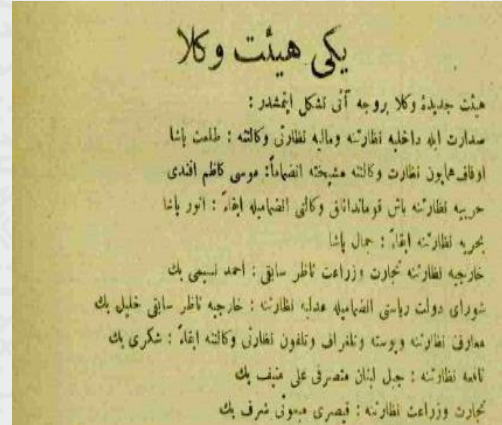
Ek 3: "Yeni Hey'et-i Vükelâ", 23 Kânunusâni 1332/ 5 Şubat 1917, Sabah).