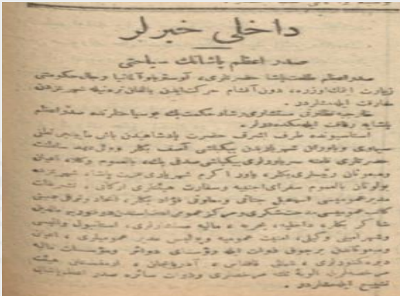
Ek 6: “Sadrâzam Paşa'nın Seyâhati”, 4 Eylül 1334/ 4 Eylül 1918, Tanin ).