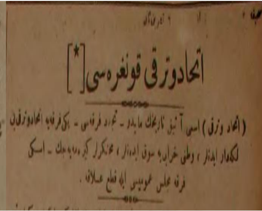
Ek 11: "İttihat ve Terakkî Kongresi", 6 Teşrînisâni 1334/ 6 Kasım 1918, Zaman ).