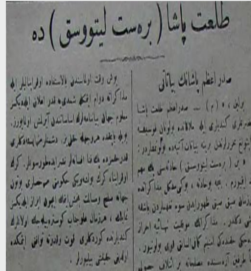
Ek 5: “Talât Paşa Breyst-Litovsk'ta”, 8 Kânunusâni 1334/ 8 Ocak 1918, Vakit ).