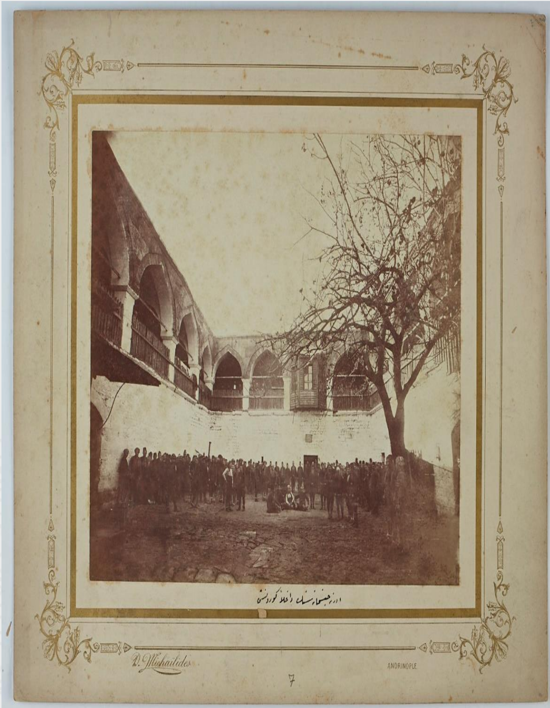
Ek 12: Talât Bey'in 1897 yılından itibaren yaklaşık iki yıl kaldığı Edirne Hapishanesinin iç görüntüsü.