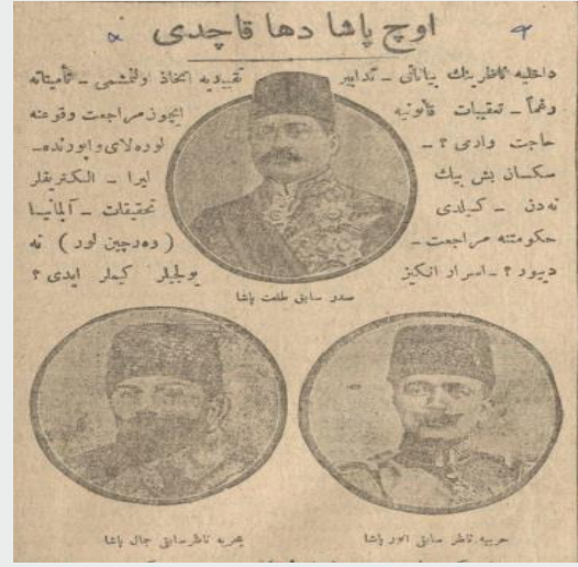
Ek 9: "Üç Paşa Daha Kaçtı?", 4 Teşrînisâni 1334/ 4 Kasım 1918, İkdam ).