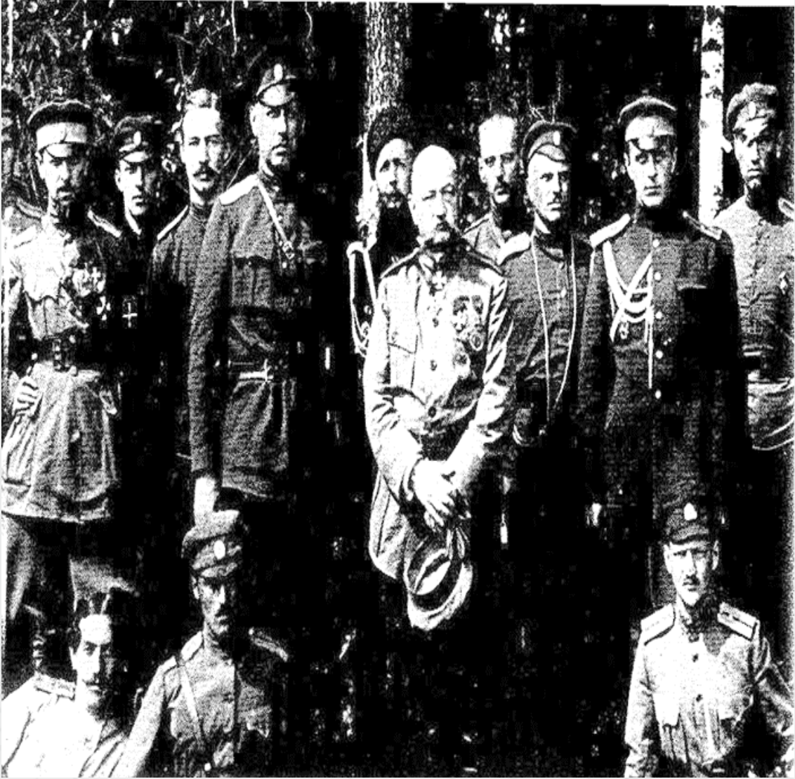
Ek 2: General Nikolay Nikolayevič Yudenič ve Kurmayları 1919 (Luckett, 1971, s. 303).