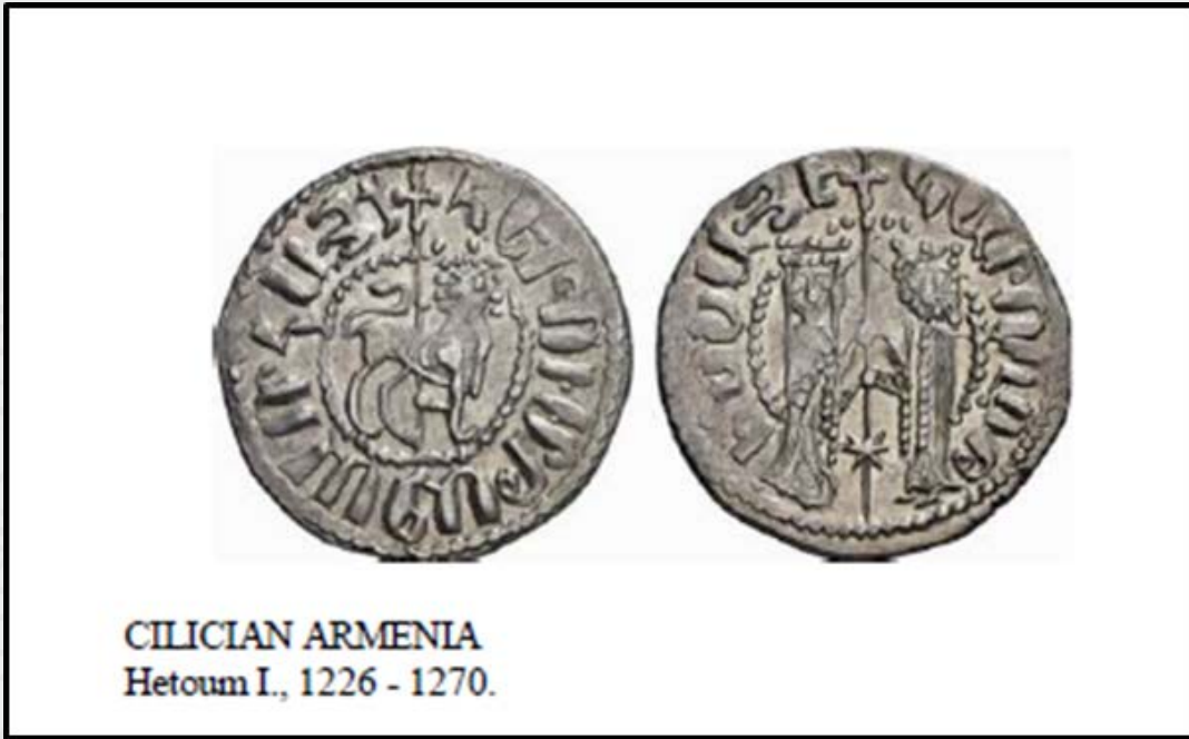
Ek-4. Kraliçe Zabel ve Kral Hetum adına bastırılan para. Cilician Armenia (1080-1375), s. 28.