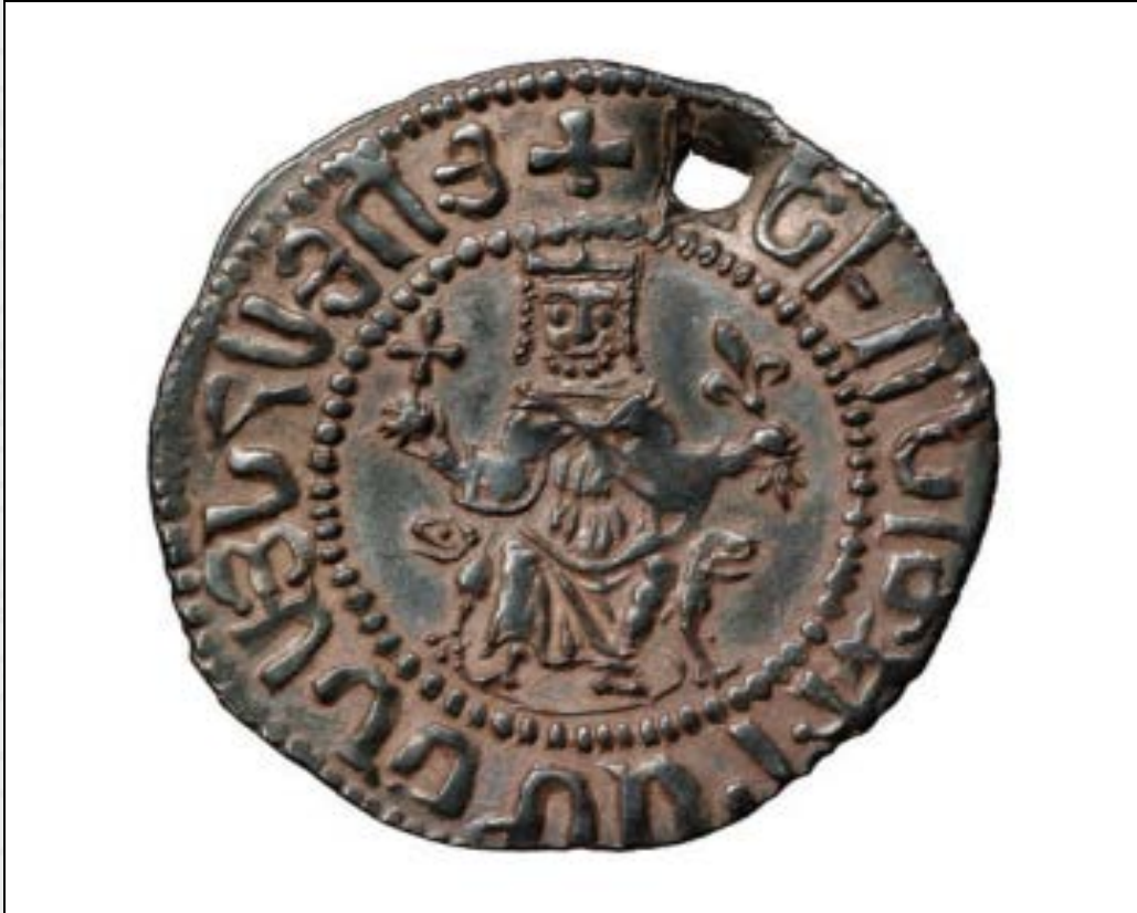
Ek-2. II. Leon (1198-1219) adına bastırılan gümüş para. Rapti, 2013, s. 328.