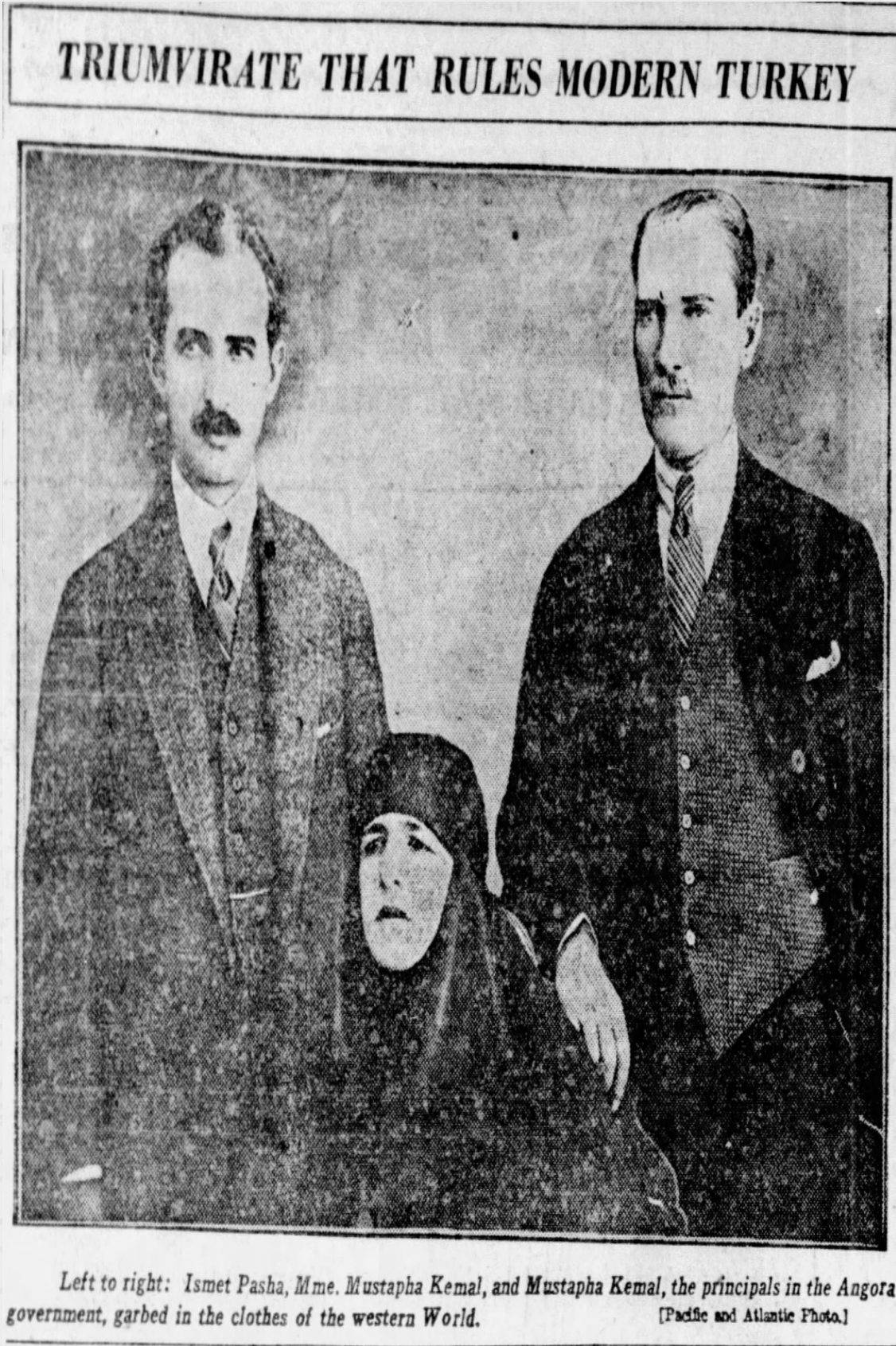
Ek 4: Chicago Tribune, October 30, 1923.