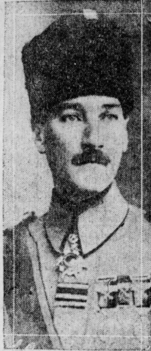
MUSTAPHA KEMAL PASHA

The National Assembly at Angora yesterday voted the establishment of a republic for Turkey, and unanimously chose Kemal as pres- ident.