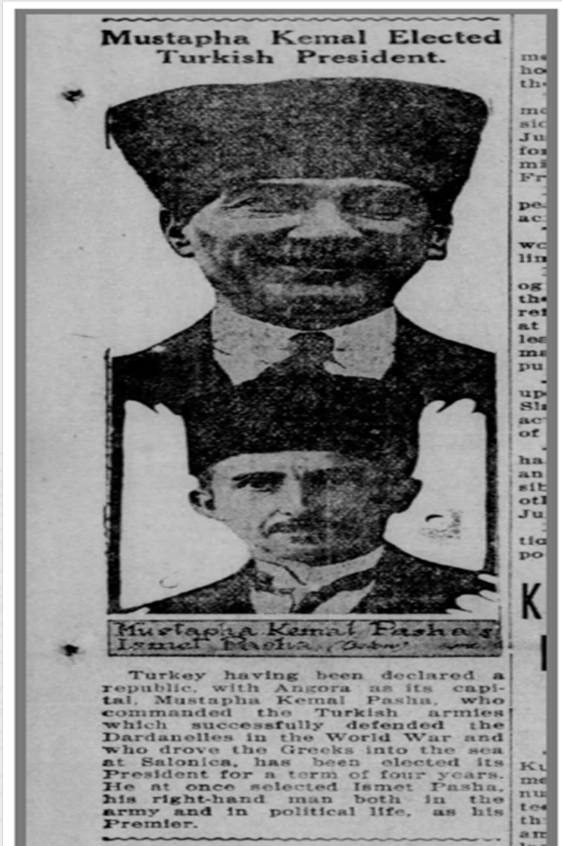
Ek 5: TheTribune, November 06, 1923.