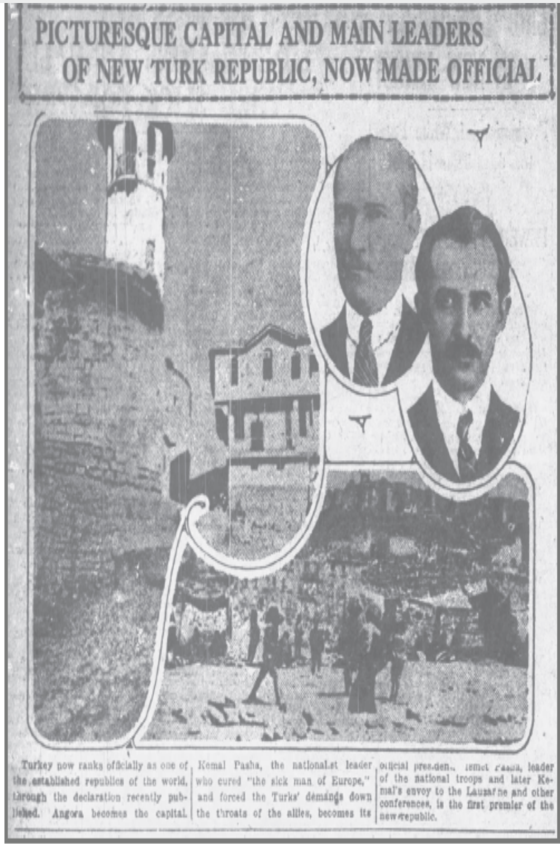
Ek 7: The Morning Post, November 13, 1923.