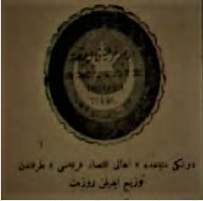
EK-3: Ahali İktisat Fırkası Tarafından 23 Mayıs 1919 Tarihli Sultan Ahmet Mitinginde Dağıtılan Rozetin Resmi (Vakit, 24 Mayıs 19119)