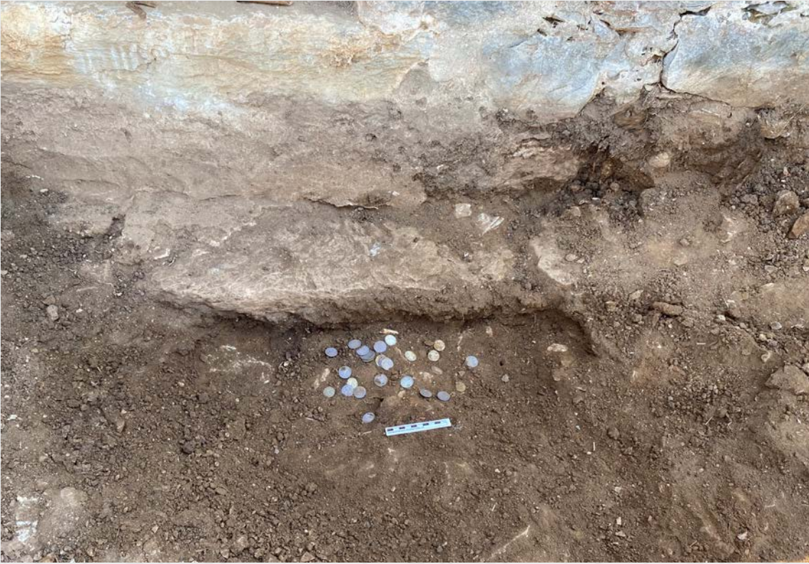
Resim 7. Anadolu Selçuklu Sikkelerinin bulunma durumu.