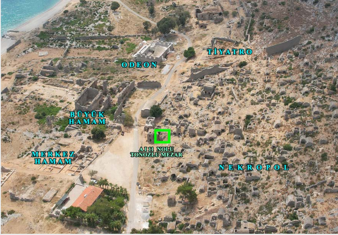
Resim 2. Anemurium A I 11 Nolu Beşik Tonozlu Mezar'ın nekropoldeki konumu.