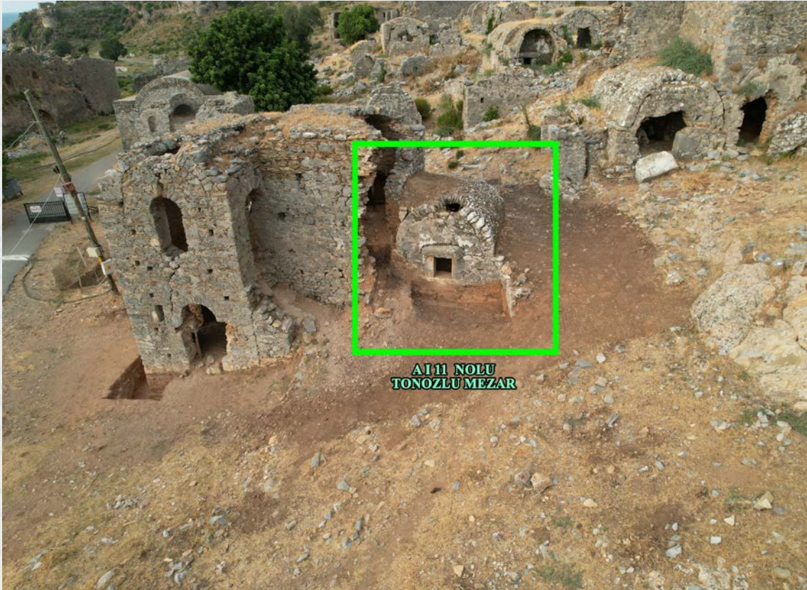
Resim 3. Anemurium A I 11 Nolu Beşik Tonozlu Mezar.