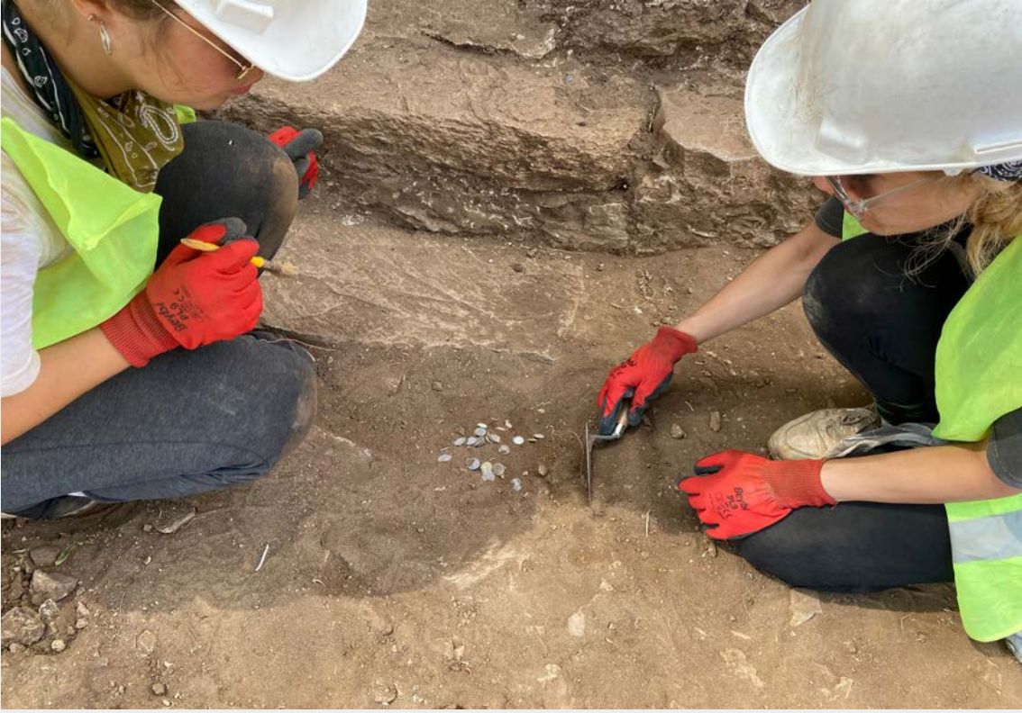
Resim 6. Anadolu Selçuklu Sikkelerinin bulunma anı.