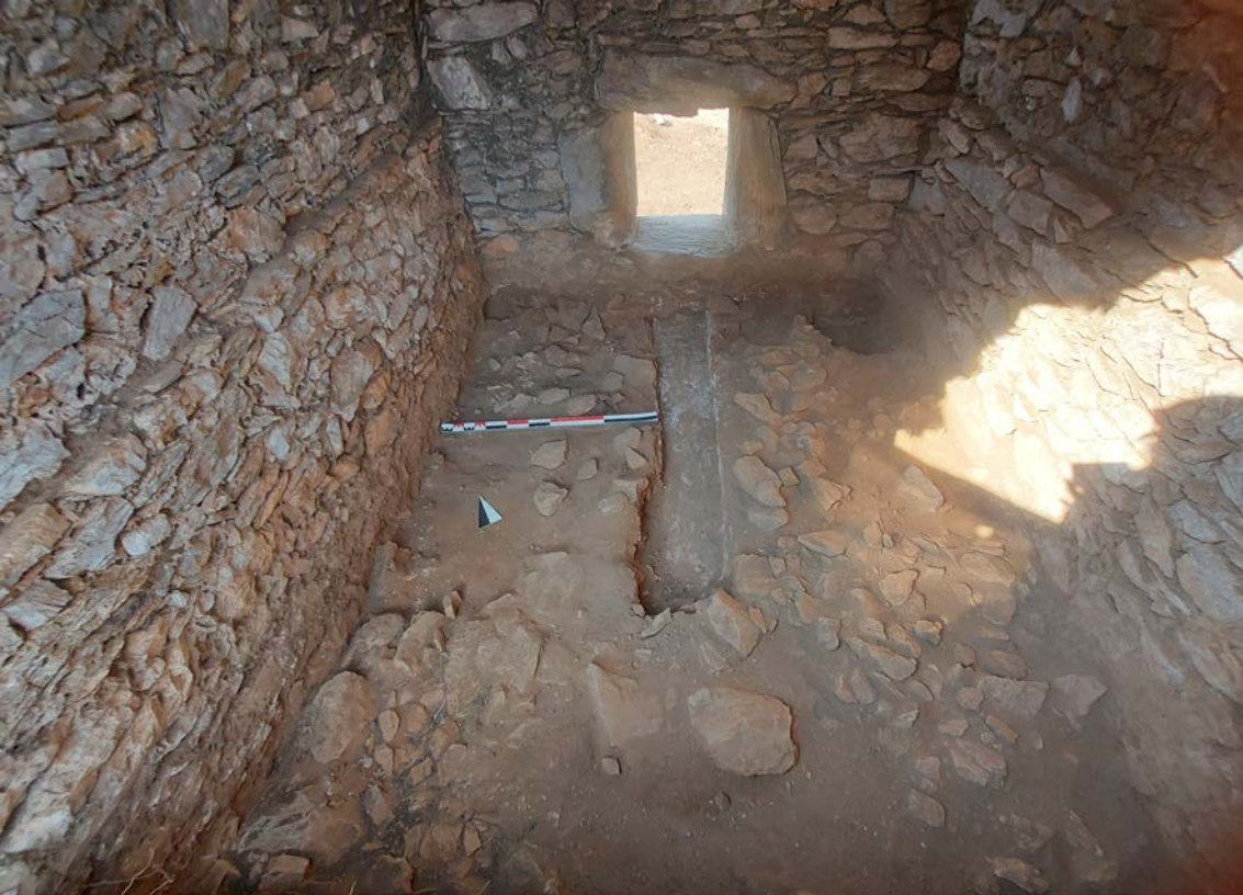
Resim 5. Anemurium A I 11 Nolu Beşik Tonozlu Mezar'ın içten görünümü.