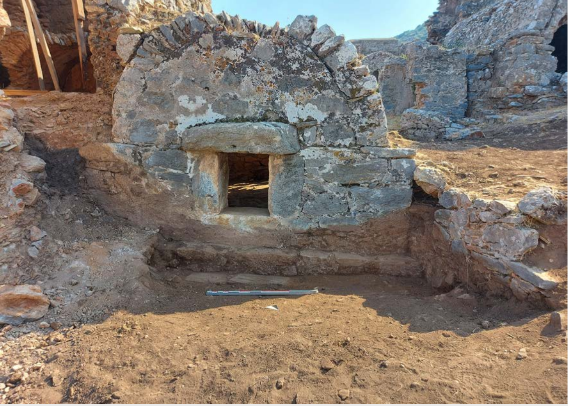
Resim 4. Anemurium A I 11 Nolu Beşik Tonozlu Mezar'ın ön cephe görünümü.