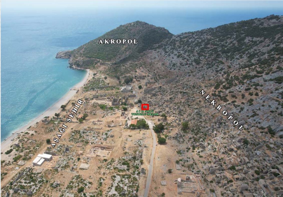
Resim 1. Anemurium Antik Kenti.