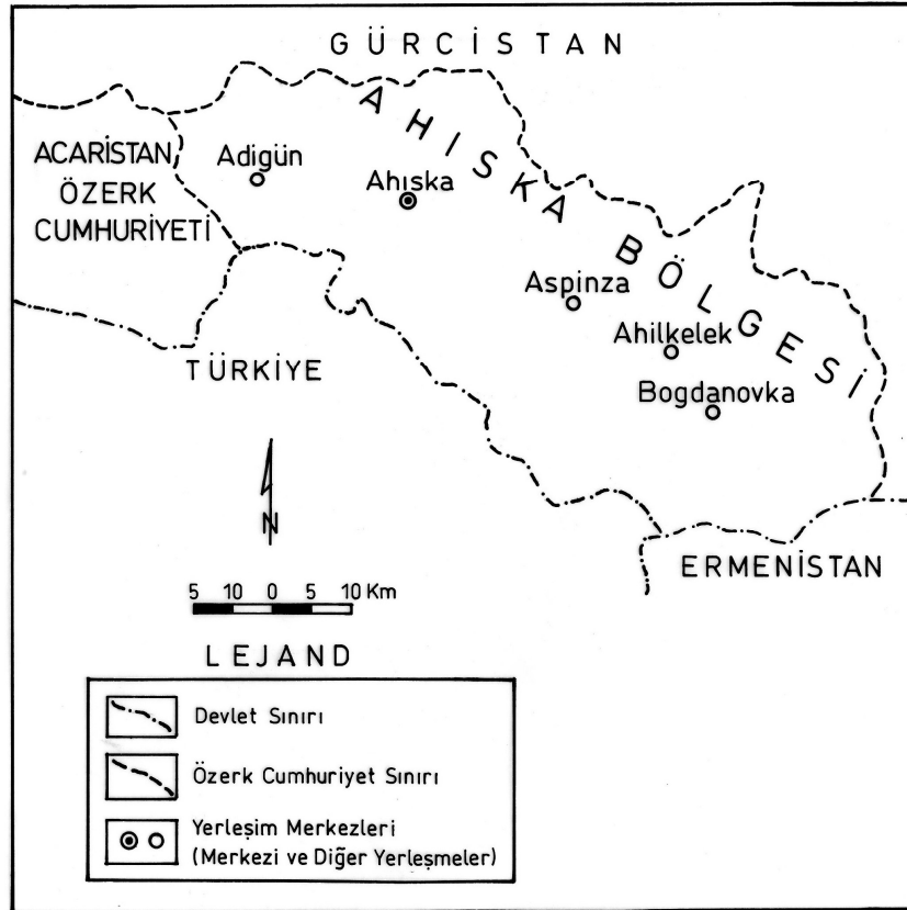
Şekil 1. Ahıska Türklerinin Anayurdunun Haritası (Agara, 2004'ten yararlanılmıştır.)

Çalışma sahası olan Ahıska, Gürcistan toprakları içerisinde Kafkasya Bölgesi'nin güneybatısında yer almaktadır. Ahıska'nın kuzeyinde ve doğusunda Gürcistan; güneyinde Ermenistan; güneybatısında Türkiye; batısında Acaristan Özerk Cumhuriyeti (Gürcistan) yer almaktadır (Şekil 1). Ahıska Türklerinin anavatanı olan bu bölge Ahıska, Adigün, Aspinza, Ahılkelek ve Bogdanovka gibi önemli yerleşim birimlerini kapsamaktadır. Ahıska bölgesinin toplam yüzölçümü ise 6.260 km 2 'dir.