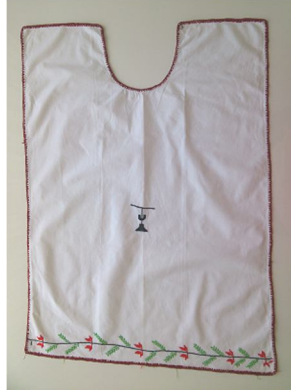
15. Resim: Mine Yayla'ya Ait Tıraş Önlüğü

Tıraş önlüğünde, beyaz patiska kumaş (pamuklu) ve beyaz dikiş ipliği (pamuklu); siyah, kırmızı, bordo ve açık yeşil el nakış ipliği (pamuklu) kullanılmıştır. 66x90 boyutlarında kesilen tıraş önlüğüne, "U" yaka tasarlanmış; kenarları terse doğru kıvrılarak oyulgama tekniği ile temizlenmiştir. Tıraş önlüğünde tığ ile yapılan süslemelerden battaniye oyası ve iğne ile yapılan süslemelerden çapraz iğne tekniği olmak üzere iki ayrı teknikte süsleme uygulanmış ve süslemede bitkisel bezeme (çiçek, dal), geometrik bezeme (üçgen, düz çizgi, kare) ve yazılı bezeme ("U" harfi, "T" harfi) konu olarak seçilmiştir.