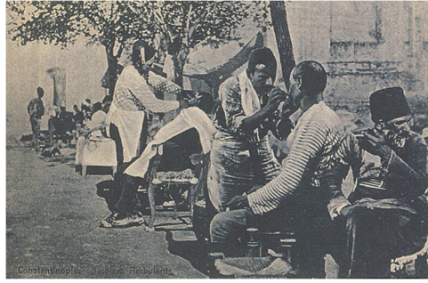
6. Resim: Seyyar Berberleri Gösteren Kartpostal (Sandalcı 1996: 42).

Geçmişte perukâr ve seyyar olarak pek çok mesleğin işlerini de yapabilen berberler, zamanla en çok saç kesme ve tıraş işleri ile ilgilenmiştir. Tıraş, insanların saç ve sakallarını değişik biçimlerde müşteri isteğine ve o günün modasına uygun olarak yıkayıp; kesme, şekil verme ve kurutma işlemidir. Tıraş, “sinekkaydı”, “natürel”, “cırlöp”, “briyantınlı” olarak isimlendirilmiştir.