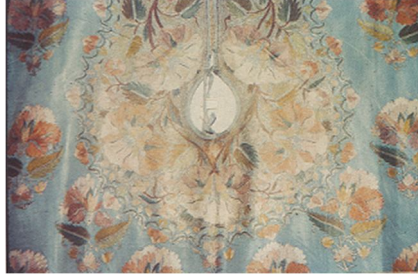
13. Resim: Yapı ve Kredi Bankası Koleksiyonundan 19. Yüzyıla Ait 1/411 Envanter Numaralı, Çizgisel Bir Sistemle, Çok Renkli Bezenmiş Tıraş Önlüğü (Barışta 1999: 145).