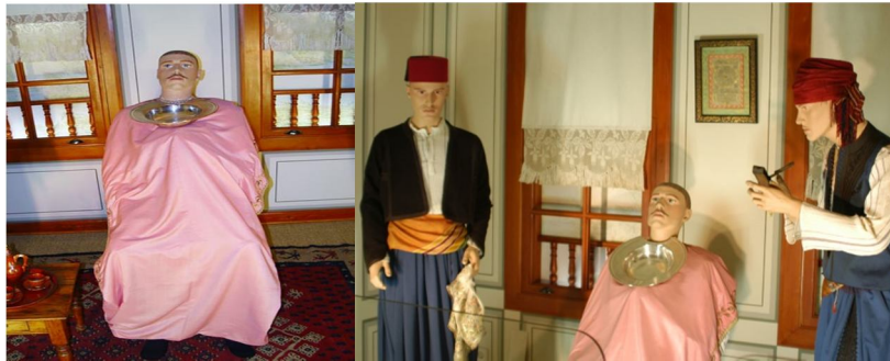
7. ve 8. Resim: Kaleiçi Müzesi Damat Tıraş Odası ( http://www.kaleicimuzesi.com/damat_tr.php Erişim Tarihi: 17.06.2012)