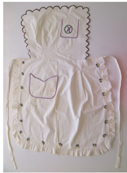
18. Resim: Arzu Çağdaş'a Ait Tıraş Önlüğü

Tıraş önlüğünde dikiş tekniği olarak makinede düz dikiş uygulanmıştır. Süsleme tekniği olarak basit nakış iğnelerinden rişliyö, sap işi ve sarma; tığ ile yapılan süslemelerden battaniye oyası tasarlanmıştır. Süslemede bitkisel bezeme (çiçek), geometrik bezeme (daire, düz çizgi) ve yazılı bezeme ("H" harfi) konu olarak seçilmiştir.