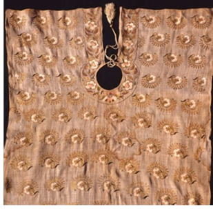
9. Resim: Türk İslam Eserleri Müzesi'nden Tıraş Önlüğü