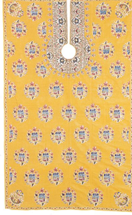
10. Resim: Sadberk Hanım Müzesi'nden 18. Yüzyıl Tarihli İpekli Kumaş Üzerine İpek İplik ve Sim Kullanılarak Suzeni Tekniğinde İşlenmiş Damat Tıraş Önlüğü (Anlağan vd. 1995: 152).