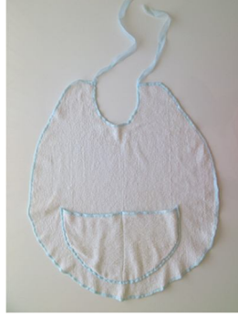
14. Resim: Hatice Boydak'a Ait Tıraş Önlüğü (Mine Yayla Fotoğraf Arşivi 2013)