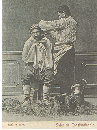
5. Resim: Seyyar Berber ve Kullandıkları Malzemeler (Sandalcı 1996: 46).