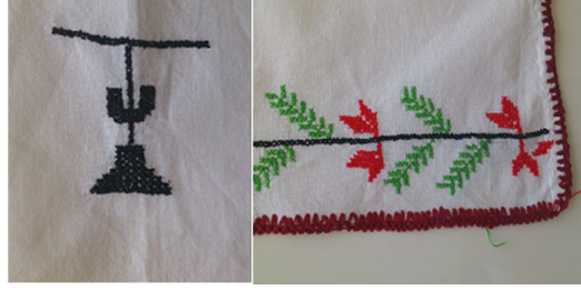
16 ve 17. Resim: Tıraş Önlüğü'nün Süsleme Detayları