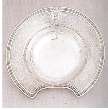
3. Resim: Sadberk Hanım Müzesi'nden Sakalı Islatmak İçin Kullanılan Tıraş Tası (Anlağan vd. 1995: 152).