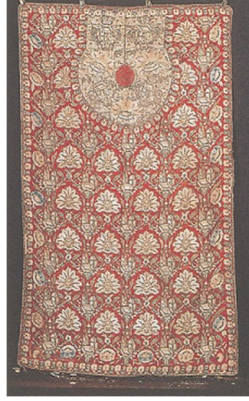
12. Resim: 1800'lü Yıllara Ait Zengin İşlemelerle Süslenmiş Bir Berber Müşteri Önlüğü (Antika Dergisi 1996: 82).