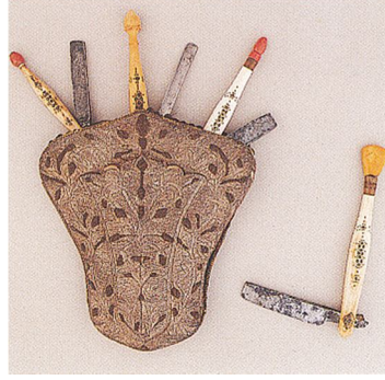
4. Resim: Sadberk Hanım Müzesi'nden, İçinde Çeşitli Usturalar Bulunan Simli Deri Ustura Kesesi (Anlağan vd. 1995: 152).

Dükkân sahibi olan berberler, seyyar berberlere karşı çıkmamıştır. Çünkü her iki berberin müşteri profili farklı olmakla birlikte dükkân sahibi berberler, seyyar berberlerin dükkân açamayacak güçte ve yetenekte olmadığını düşünmüş ve kendilerine rakip olarak görmemiştir (Aksu 1996: 19). Seyyar berberler genellikle müşterilerini bir duvar dibinde veya köşe başında tıraş etmiştir. Seyyar berberlerin malzemelerini bir kömür ocağı, içinde su ısıtılan küçük bir güğüm, bir tabure, ustura, makas, ayna gibi aletlerin taşındığı bir sepet oluşturmaktadır (5. Resim). Bunların yanı sıra küçük leğen ve tıraş önlüğü, seyyar berberlerin müşterilerini tıraş ederken kullandığı diğer malzemelerdir. Ayrıca seyyar berberlerin bele takılan bir önlüğü ve omuza atılan havlusu (6. Resim) olmazsa olmazlarıdır (Sandalcı 1996: 46). Seyyar berberler, şehirlerde mesleklerini icra etmenin yanında köylere de gitmiş ve bazı köylerde bir tıraş için üç yumurta, iki tıraş için bir kalıp peynir, bir saç kesimi için de bir piliç gibi erzakları para yerine almıştır (Akkoç 1953: 2804).