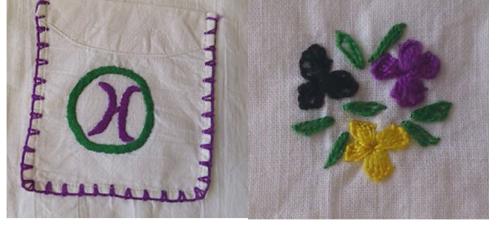
19. ve 20. Resim: Tıraş Önlüğü'nün Süsleme Detayı