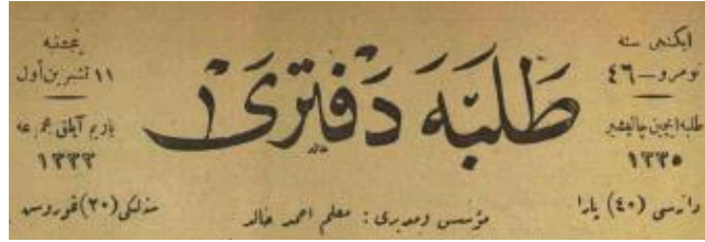
Resim 2: Talebe Defteri Dergisi'nin İç Kapağı

Derginin iç kapağında ise, üstte ortalı biçimde derginin adı, adın sağ kısmında üstte sene, numara; altta “Talebe için çalışır” ibaresi, hicri yılı, onun da altında adet fiyatı; adın sol kısmında üstte gün ve ay, altta yayın periyodu, onun altında da rumî sene bilgisi ve senelik abonelik bedeli yer alır. Dergi adının altında Müessis ve Müdürün Ahmet Halit olduğuna dair bilgi verilir. Bu kısmın altı yatay bir çizgi ile çizilidir. Sayfanın geri kalan kısmında makale ya da açıklamaya yer verilir.