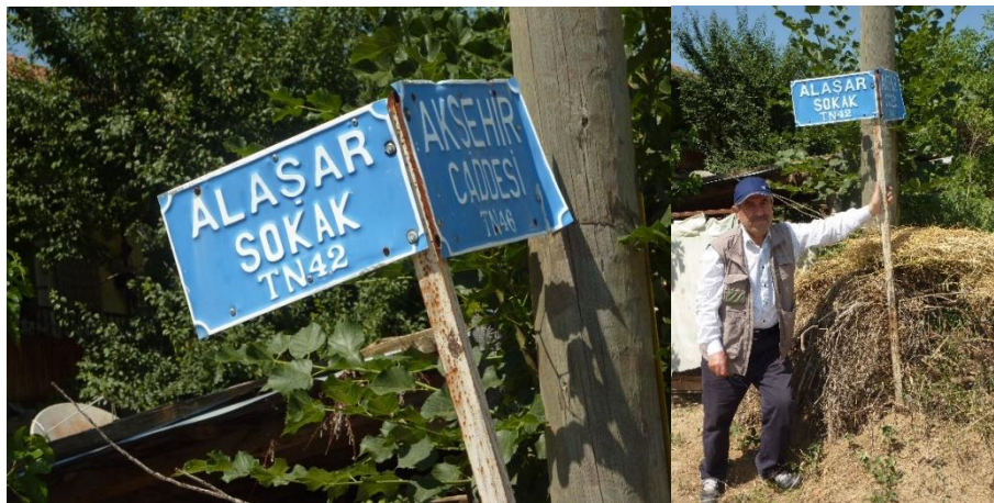
Eski Alaşehir (Yalvaç)-Konya Yolu üzerinde bulunan ve Alaşehir'e işaret eden Yalvaç-Örkenez (Bağkonak)'deki Alaşar sokak görülmektedir.